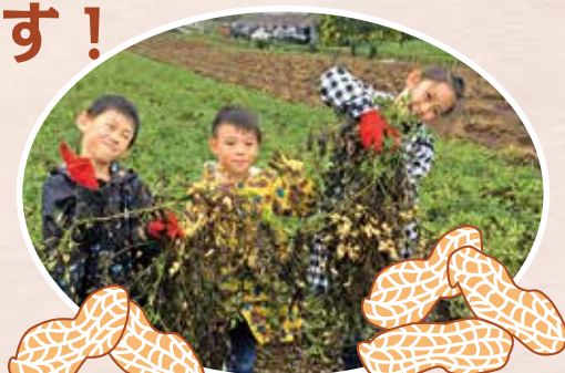
(落花生はアレルギー特定原料7種に含みます)

アクセス JR 四街道駅から/市内循環バス「ヨッピー」で 「鹿放ヶ丘ふれあいセンター」下車 (約15分) 四街道 IC から/車で9分、千葉北 IC (八千代・柏方面出口) から/車で11分 (お車で越しの方は、鹿放ヶ丘ふれあいセンター駐車場をご利用いただけます。)